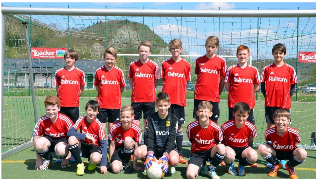
Gruppenfoto der erfolgreichen D1-Jugend der Saison 2014/2015

Auch in der Pokalrunde konnte mit zwei souveränen Siegen gegen Alflen und Kottenheim und mit dem sensationellen Sieg gegen den Bezirksligisten aus Immendorf sogar die vierte Runde erreicht werden. In diesem Spiel zeigte sich das Potential der Mannschaft, das den kommenden sehr erfolgreichen Verlauf der Saison erahnen ließ. Der 2:1 Sieg war durchaus verdient auch wenn es in der Schlussphase nochmals spannend wurde. Mit dieser tollen Leistung ging es dann in die Winterpause.