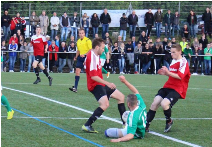
Typischer Kampf um den Ball beim Entscheidungsspiel in Mertloch. Überzahl für unser Team.